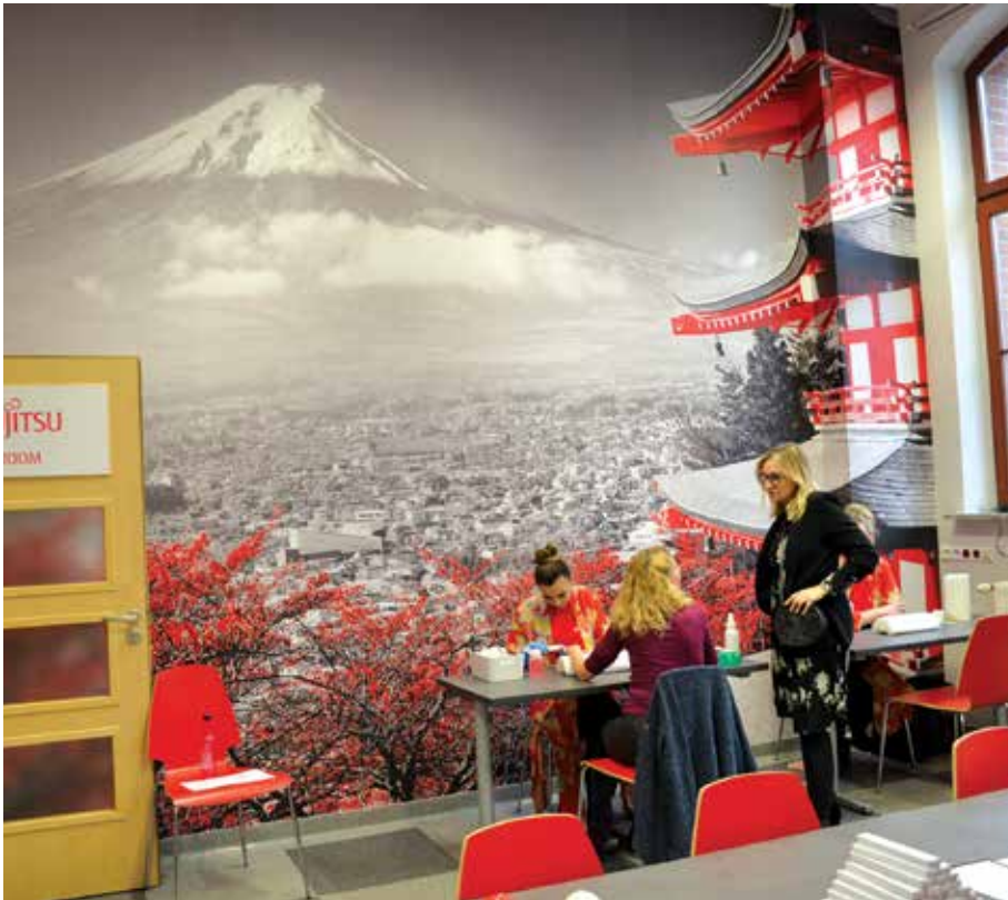
Ozdobą sali jest tapeta z widokiem na Fuji