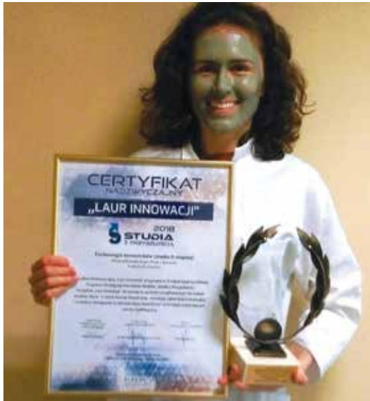
Certyfikat i Laur Innowacyjności dla studiów na BiNoŻ