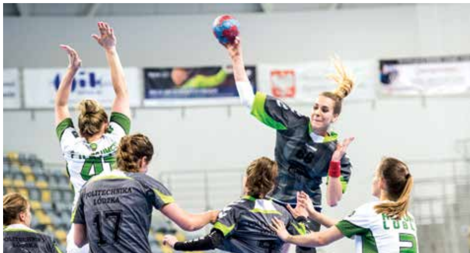
Zacięta walka o zwycięstwo w AMP

Na Akademickich Mistrzostwach Polski w piłce ręcznej kobieca reprezentacja Politechniki Łódzkiej zdobyła srebrny medal w klasyfikacji generalnej i złoty wśród uczelni technicznych.