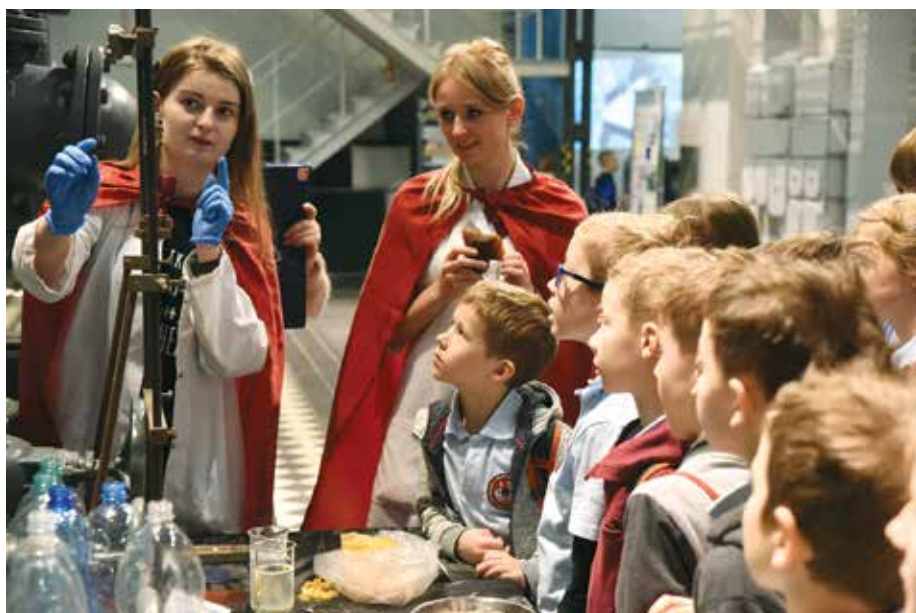
Plastikowy świat wokół nas.