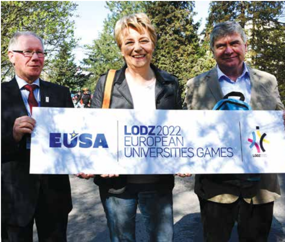
Po powrocie z Madrytu