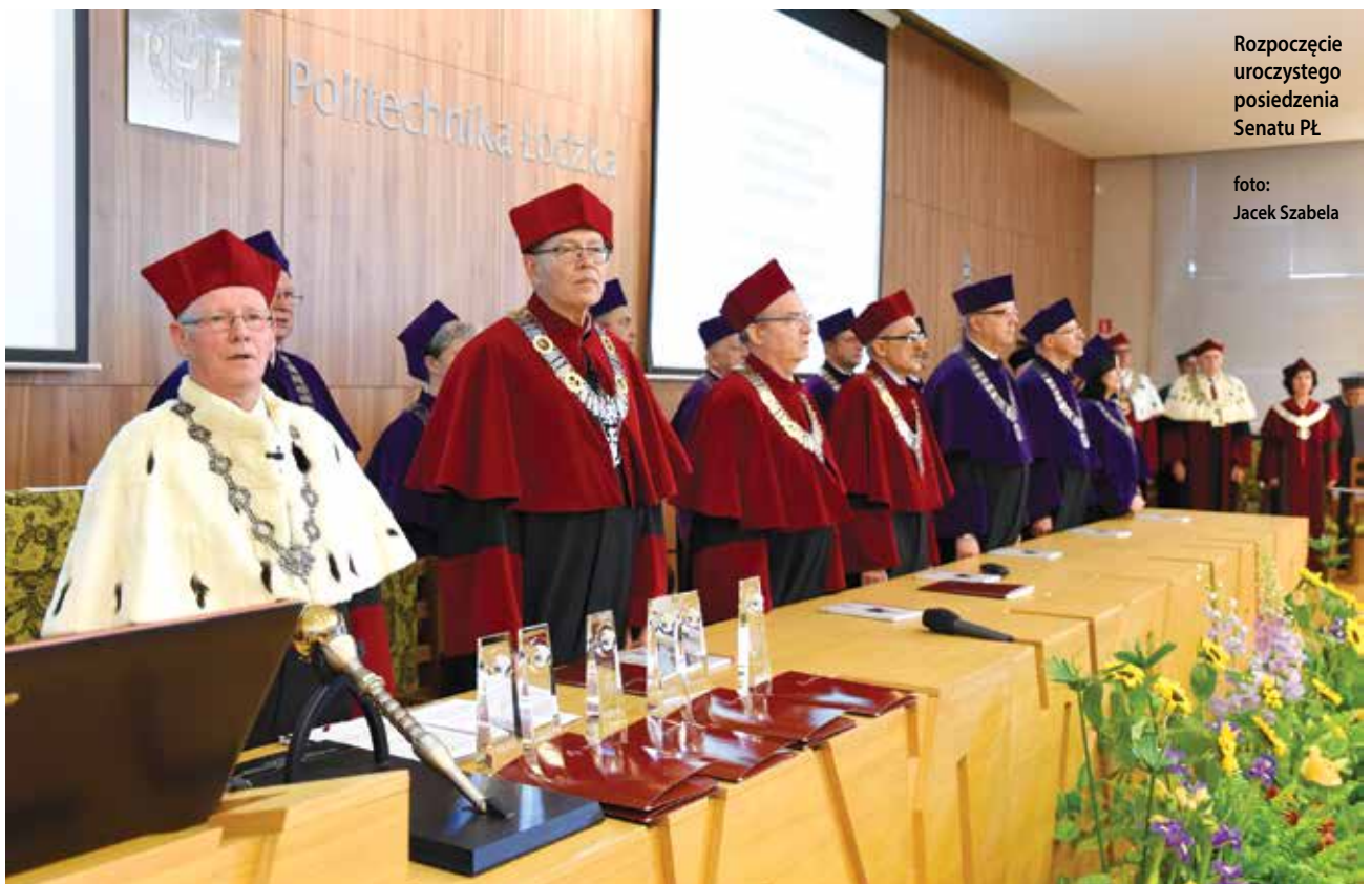
Rozpoczęcie uroczystego posiedzenia Senatu PŁ