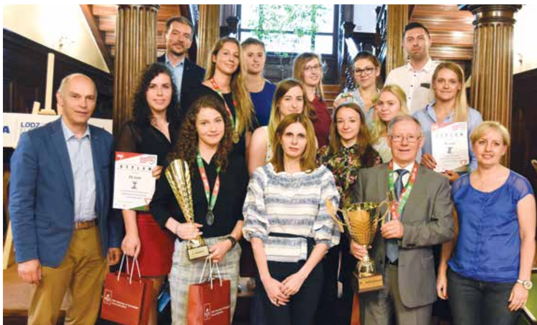
Pamiątkowe zdjęcie po spotkaniu u rektora