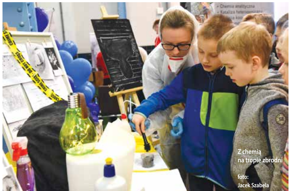
Z chemią na tropie zbrodni